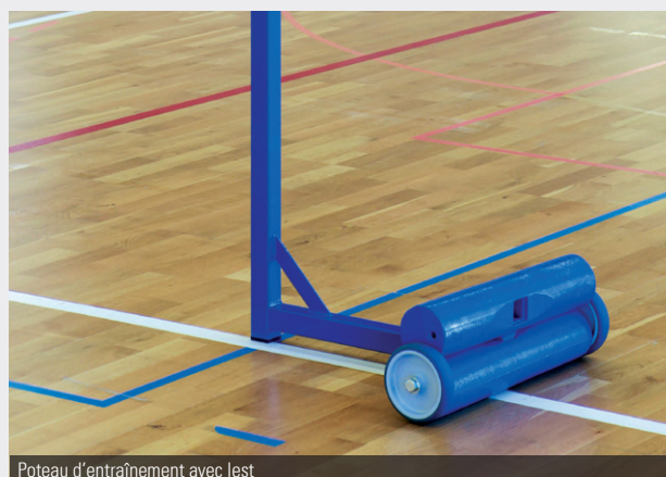
Poteau d'entraînement avec lest