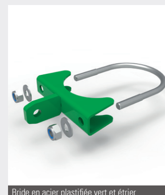
Bride en acier plastifiée vert et étrier