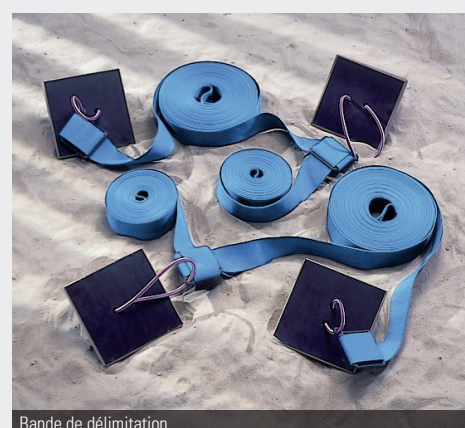
Bande de délimitation