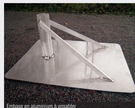
Embase en aluminium à ensabler