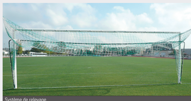
Système de relevage