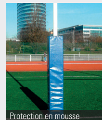
Protection en mousse