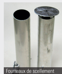
Fourreaux de scellement