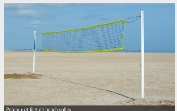
Poteaux et filet de beach volley